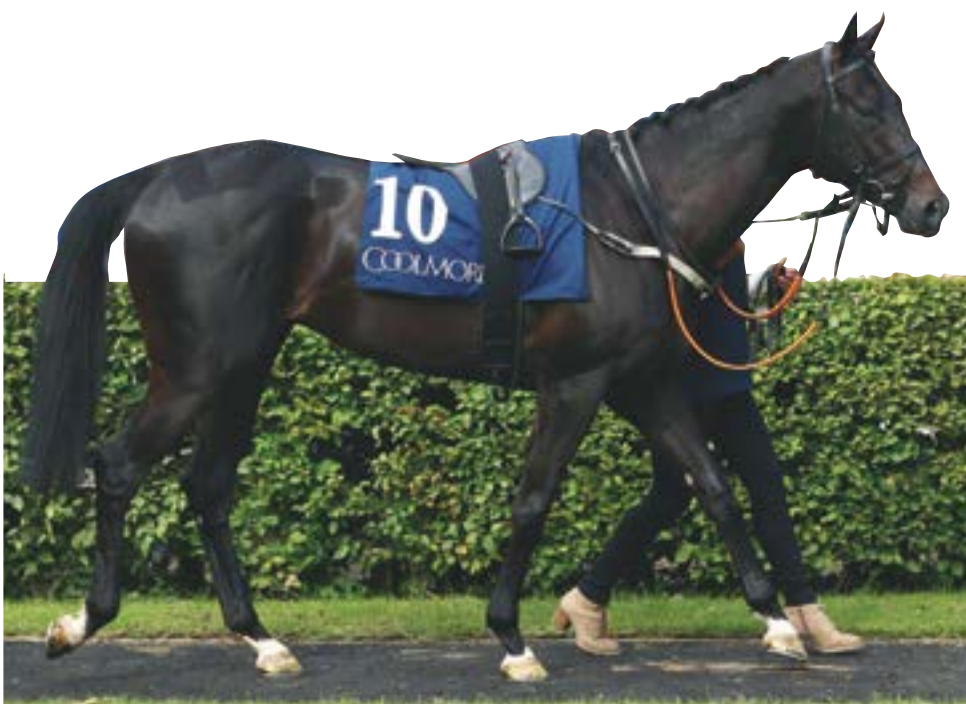
Wikinger soll auf Black Type-Niveau angreifen

Die Trainereinschätzung: Bodenvorlieben: Braucht wohl weicheren Boden Distanz: Wohl ab 2000 Meter, vielleicht auch einen Tick kürzer Perspektive: Wird sich auf die französische Provinz konzentrieren Besonderheit: Französische Inländerin