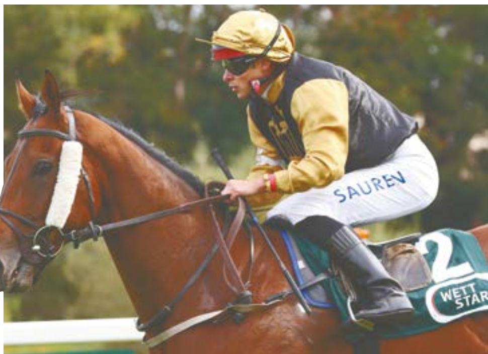
Muss man in „Jffze“ beachten: Santino Corleone