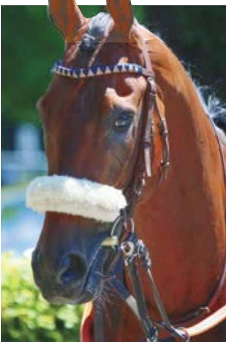
Der erste Sieger 2025 - Daliapur