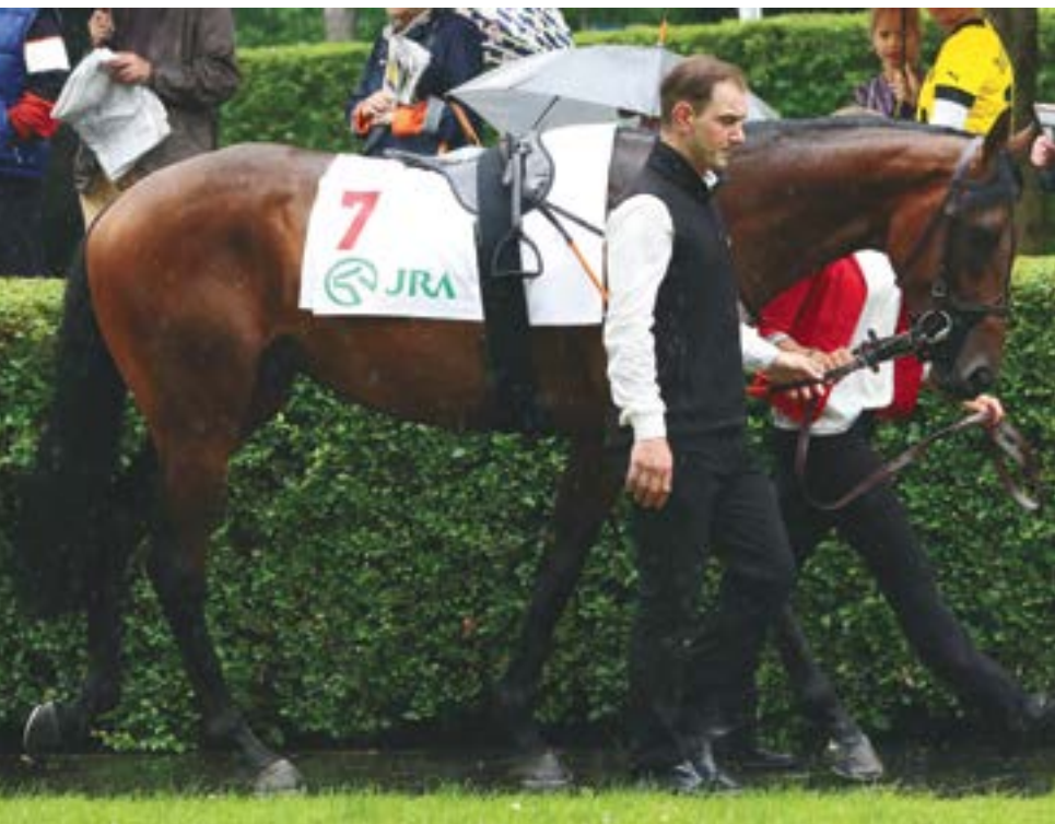
Tuppes bekommt nun zunächst eine Pause