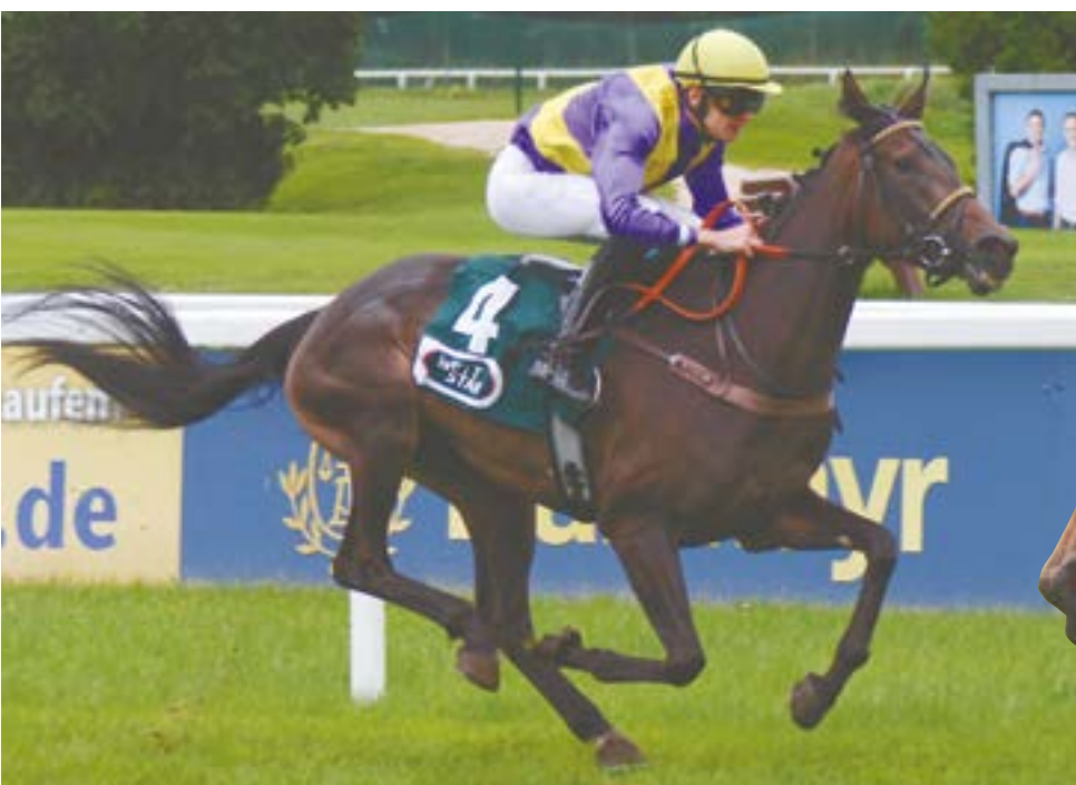
Zamnesia hatte einen erfolgreichen Ausflug an die Côte d'Azur