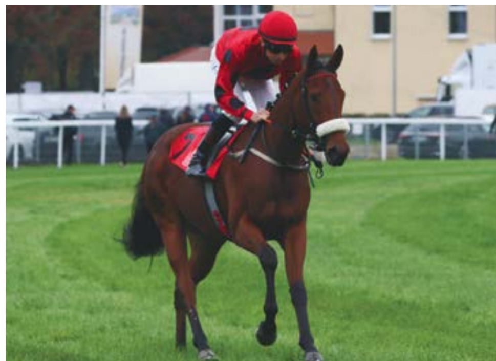
Pershing könnte eine Stute für die Guineas sein