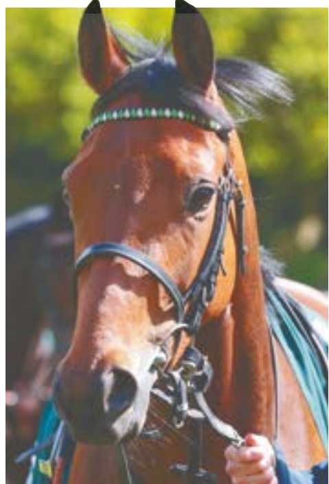
Analytics sollte etwas nachholen