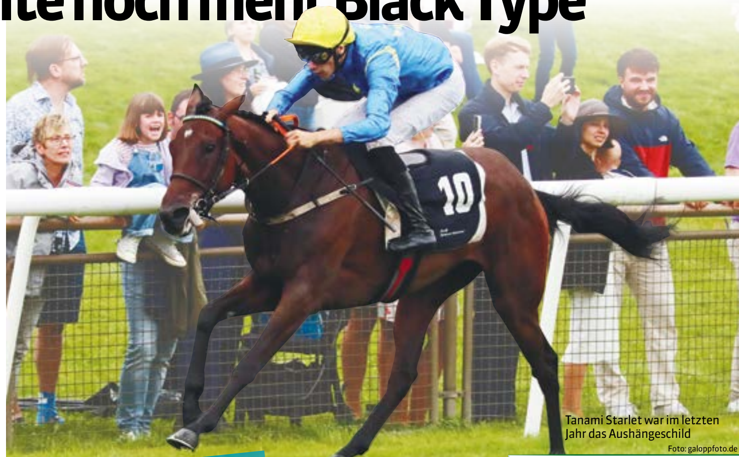
Tanami Starlet war im letzten Jahr das Aushängeschild